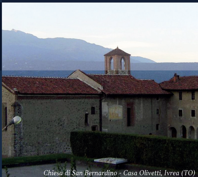
Chiesa di San Bernardino - Casa Olivetti, Ivrea (TO)

La partecipazione è gratuita, fino a esaurimento dei posti disponibili. È richiesta l'iscrizione.